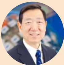
香港品質保證局主席 何志誠工程師