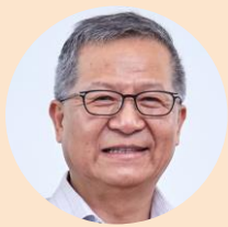
前香港天文台助理台長 梁榮武先生