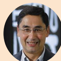
香港生產力促進局 總裁 畢堅文先生