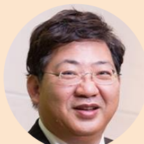
香港恒生大學校長 何順文教授